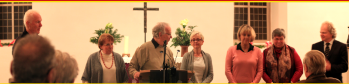
↑ Adventslesung Kapelle Marienau Lichterfest-Vorbereitungsteam ↓