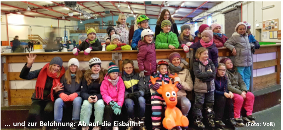
... und zur Belohnung: Ab auf die Eisbahn!