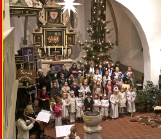
↑ Nikolaus in St. Nicolai Krippenspiel ↑ ↓ Mini-Gottesdienst: Körbchen für Brot und Fische ↓